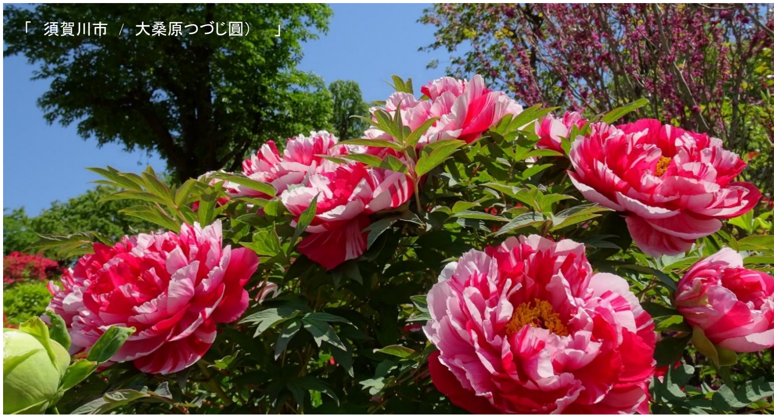
「須賀川市 / 大桑原つづじ園」

発行日 2019年6月1日 発行所 (有)介護福太郎 発行責任者 代表取締役 内海好一 会津若松市中央二丁目1-21 TEL 0242-37-2166 FAX 0242-85-7021 Eメール fukutaro@basil.ocn.ne.jp