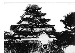
戊辰戦争後の鶴ヶ城

長瀨の上流北高野村の北、右岸に駒形堰の取り入れ口がある。この堰については、「駒形堰由来記」塩川町金森の小林家文書に記されている。金森他六か村は古来、雄国山麓からの沢水や雨水に頼ってきたが、度重なる渇水に苦勞してきた。由来記によれば、「往古元禄・宝永年中の頃、猪苗