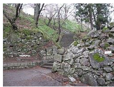
現猪苗代城跡 (大手口)

一、若松城 新藩主喜徳が留守を守り士中白虎一番中隊が護衛にあたる。会津軍の主力を大野原に向けて日橋川の線で官軍の進攻を止め、その背後を突いて猪苗代城を奪還する作戦だった。主力とは百姓や町人を集めた民兵でたのみにしていなかった。だが、会津藩の運命をかけた一戦であり、午前九時ころ